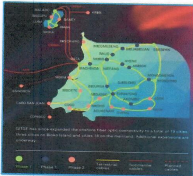
Figura 3: Cables submarinos internacionales y red troncal terrestre.

El siguiente mapa muestra los cables submarinos que dan servicio a la República de Guinea Ecuatorial, así como la red de transmisión interurbana.